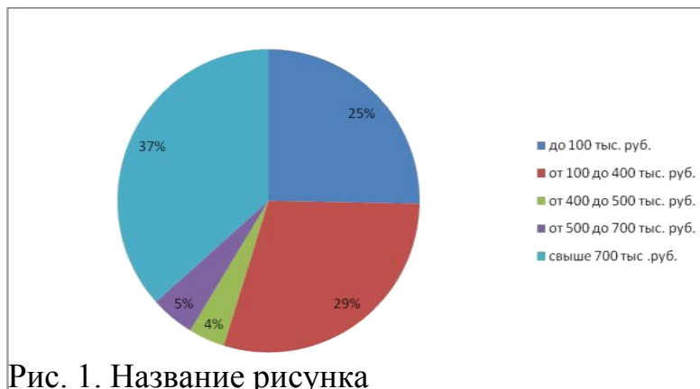
Рис. 1. Название рисунка